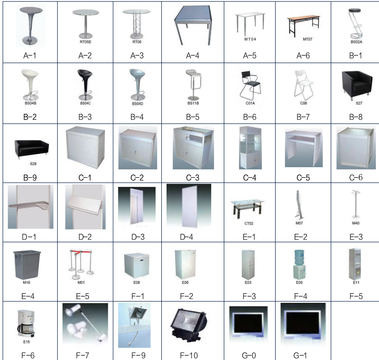
展具图片明细表 (附1)